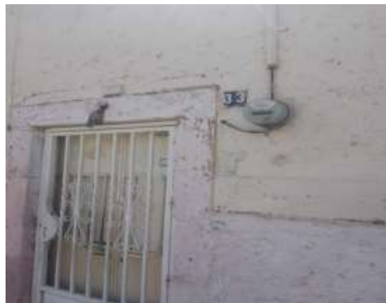
Por calle Abasolo