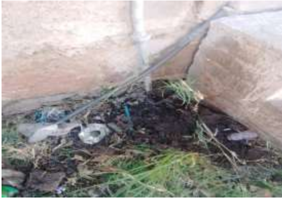
Calle Manuel M. Diéguez