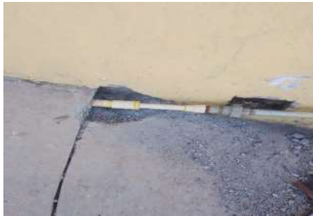
Calle Cosío Vidaurri