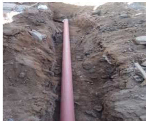
Inst. drenaje por calle Circunvalación