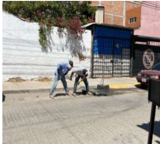
Desazolve de drenaje en calle Corona Esq. Defensores frente al Mamut