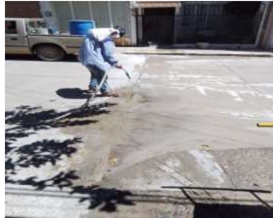
Reparación toma por calle Fco. Sarabia