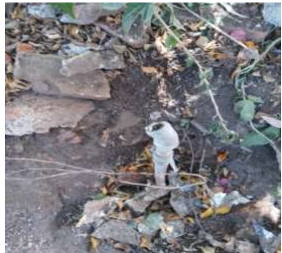
Reparación de toma corral de piedra, de Jesús Ventura