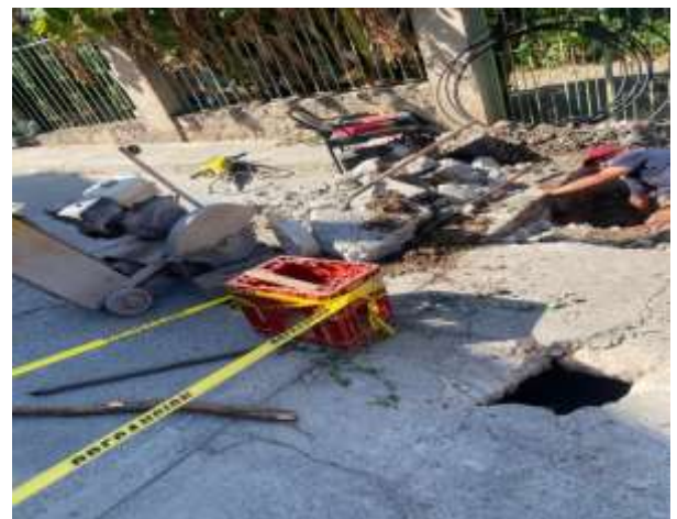
Apoyo en reparación de fuga en Huascato Jal