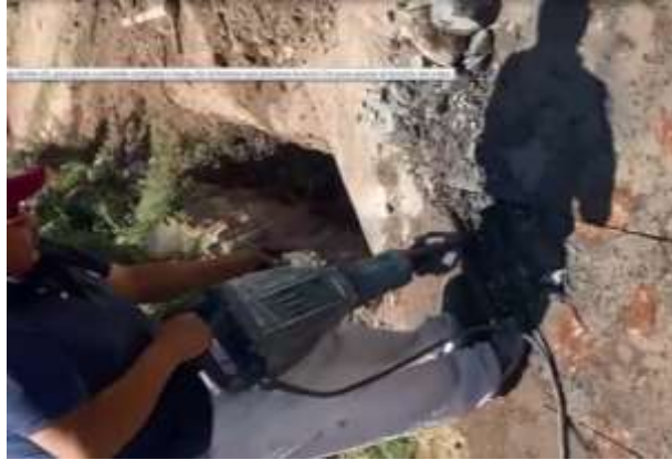
Apoyo en reparación fuga en la Tinajera