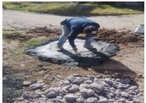
Reparación de brocal. Frente a estadio el Volcán