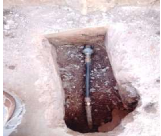
Reparación toma por calle Prol. Allende