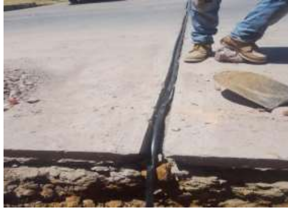
Inst. toma calle Chamizal Esg. Blvd. Eleazer Ayala