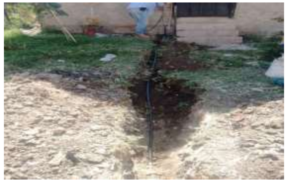
Reparación de toma por calle Abelardo L. Rgz.