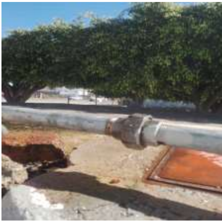
Calle 1 de mayo