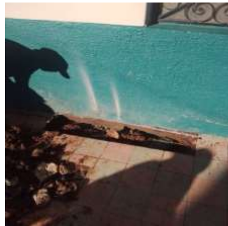
Calle A.S. Bravo