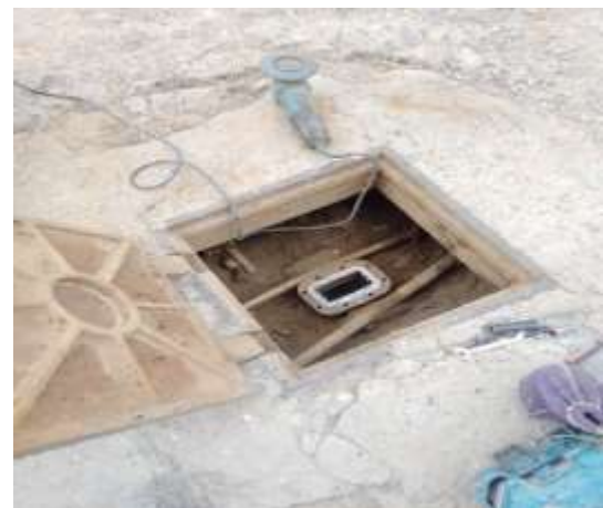
Calle 5 de Febrero