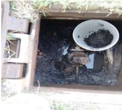
San José Buen Agua