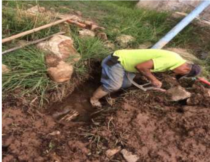
Reparación línea de depósito Marijo