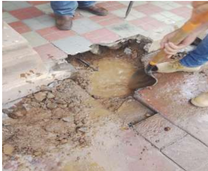
Reparación toma en portal Obregón