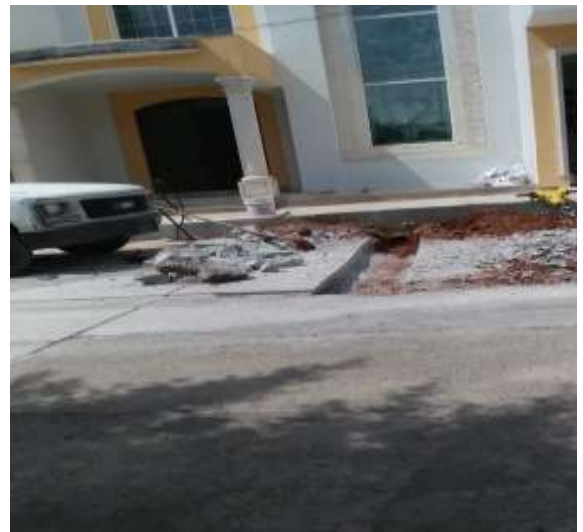
Reparación fuga de agua