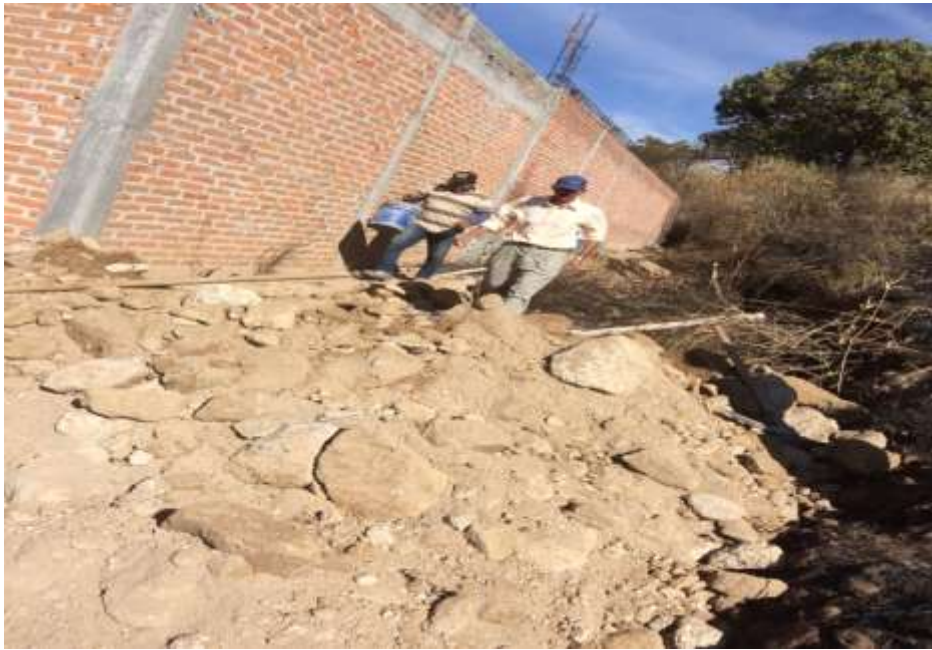
Instalación Agua y Drenaje