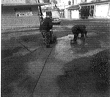
Calle 20 de Noviembre Esq. Allende