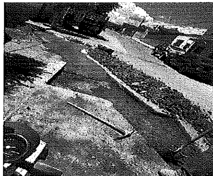
Calle Zaragoza #68