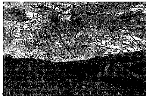
Calle Rufino Tamayo