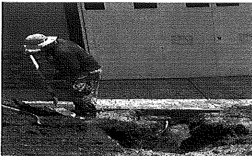
Calle Adolfo Mateos