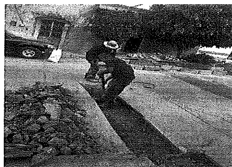
Calle 31 de Diciembre, Col. Juan Gil Preciado