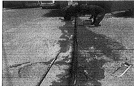
Calle A.S. Bravo