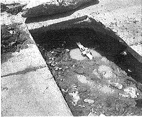
Calle Enrique López