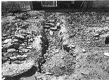
Calle 16 de Septiembre