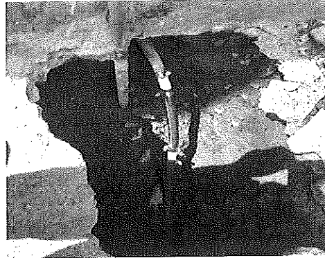
Calle Juárez #139