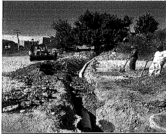
Calle Pedro Moreno #300