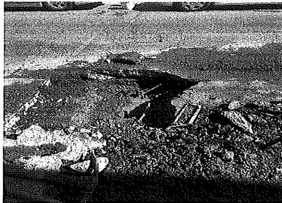
Calle 16 de Septiembre