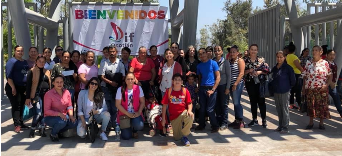
Personal del DIF Degollado trabajando para apoyar con la comida en los juegos magisteriales que se estarán llevando a cabo el día de hoy en nuestro municipio