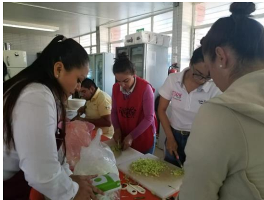
El Sistema DIF Degollado por medio de su área de Alimentaria realiza la entrega del programa “DESAYUNOS ESCOLARES” mediante el cual se beneficia a niños con vulnerabilidad económica y nutricional de nuestro municipio.